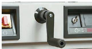
正確な寸法合わせが可能な調整機能型クランクハンドル