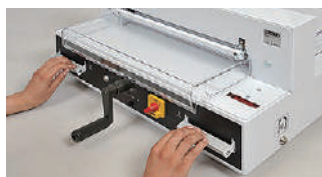
安全と使い易さを兼ね備えた両手式ハンドル。