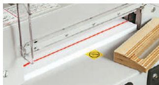
裁断場所が一目でわかる赤色LED式カットライン