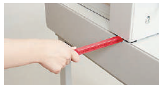
受木交換も簡単にできるスライド式