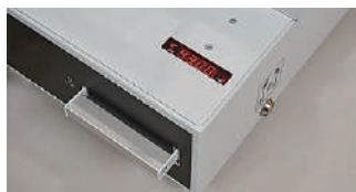
クランクハンドルと連動したデジタル式スケール