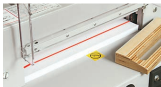
裁断場所が一目でわかる赤色LED式カットライン