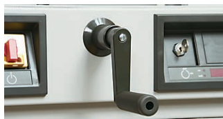
正確な寸法合わせが可能な調整機能型クランクハンドル