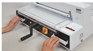
安全と使い易さを兼ね備えた両手式ハンドル。