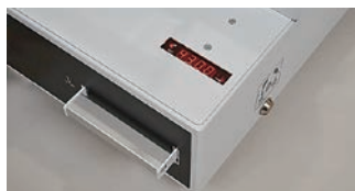
クランクハンドルと連動したデジタル式スケール