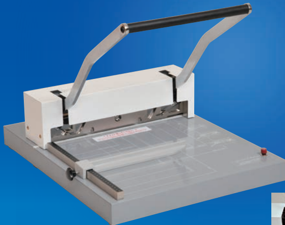
赤色LEDカットランプ